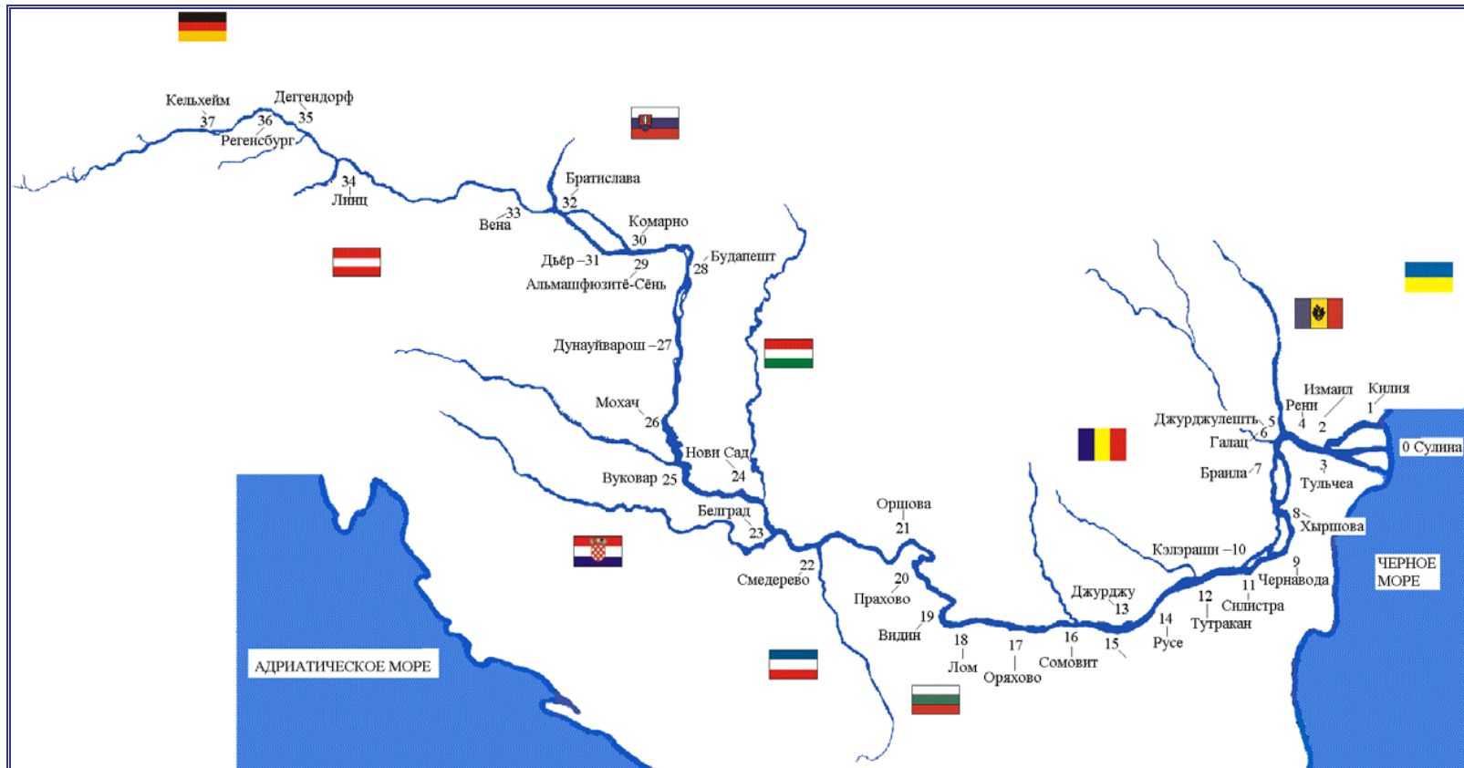
Рисунок I.2 УЧАСТКИ РЕКИ ДУНАЙ ПО СТРАНАМ