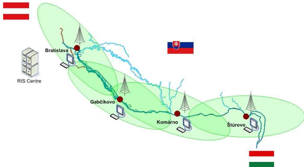
Схема расположения и покрытия береговых станций АИС на словацком участке и на совместных словацко-австрийском и словацко-венгерском участках Дуная